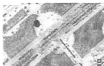
2. XOCOLATER Emplazamiento