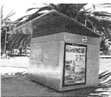
2. XOCOLATER Fotografías